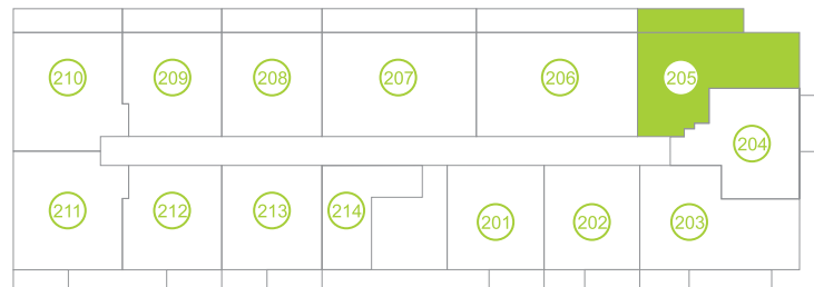
Půdorys podlaží/ Floor plan